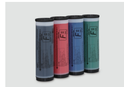
RISO FII TYPE 彩色油墨 (1000 ml)

RISO iQuality 標誌代表 RISO 產品與 RISO iQuality 系統相容