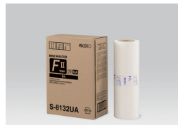
RISO 版紙 FII TYPE (B4: 每卷 250 張)