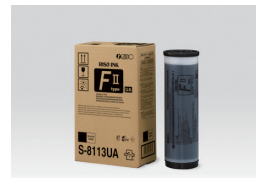
RISO FII TYPE 黑色油墨 (1000 ml)